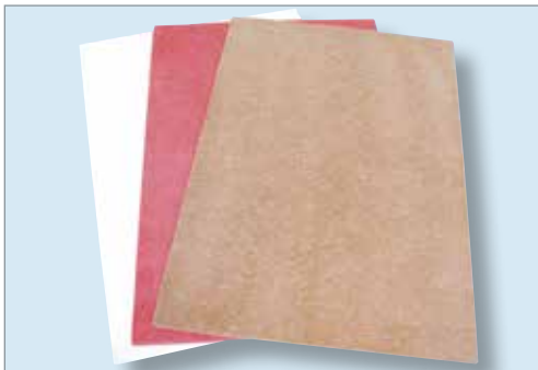
INTERDENS Typ 15 und Typ 36.

Wird es Feuer ausgesetzt, produziert INTERDENS schnell eine große Menge von mikroporösem wärmeisolierendem Schaum, der das behandelte Material vor Feuer schützt. Er passt sich hermetisch den Spalten an, die durch den Verzug gebildet werden, und verhindert das Eindringen von Flammen, Rauch und Gasen zwischen zwei Bauelemente.