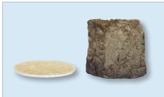
INTERDENS Typ 36 vor und nach Kontakt mit Feuer